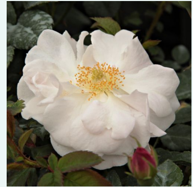
Félicité et Perpétue

hell-rosa - historische, centifolia-rose 140-220 cm stark duftende, gut wahrnehmbare rose - klassisch rosiger charakter Edward A. Bunyard