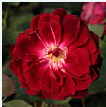
Gruss an Teplitz