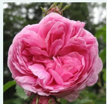
Rose des Peintres

purpur - historische rose, portland-rose 85-135 cm sehr stark duftende, von weitem wahrnehmbare rose - klassisch, rosenartig -