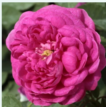
Rose de Resht

grün - historisch, china-rose 80-130 cm sehr schwache, kaum wahrnehmbare duftrose - würzig John Smith