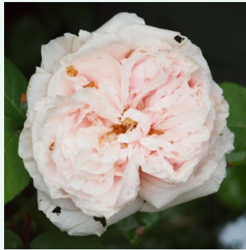
Änchen von Tharau